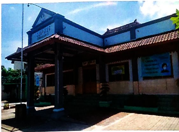
Foto 1 Tampak Depan Dalem Jayanegaran Menghadap Selatan