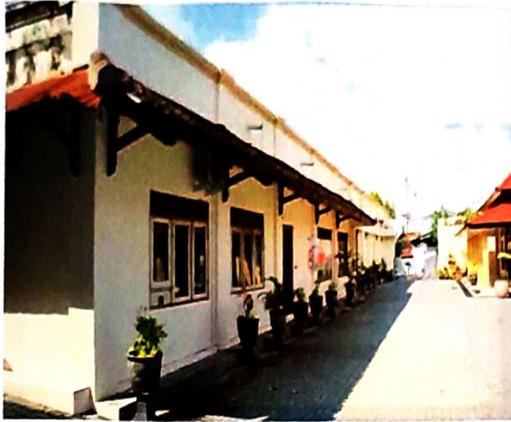
Foto 2 Tampak Samping Barat Dalem Jayanegaran