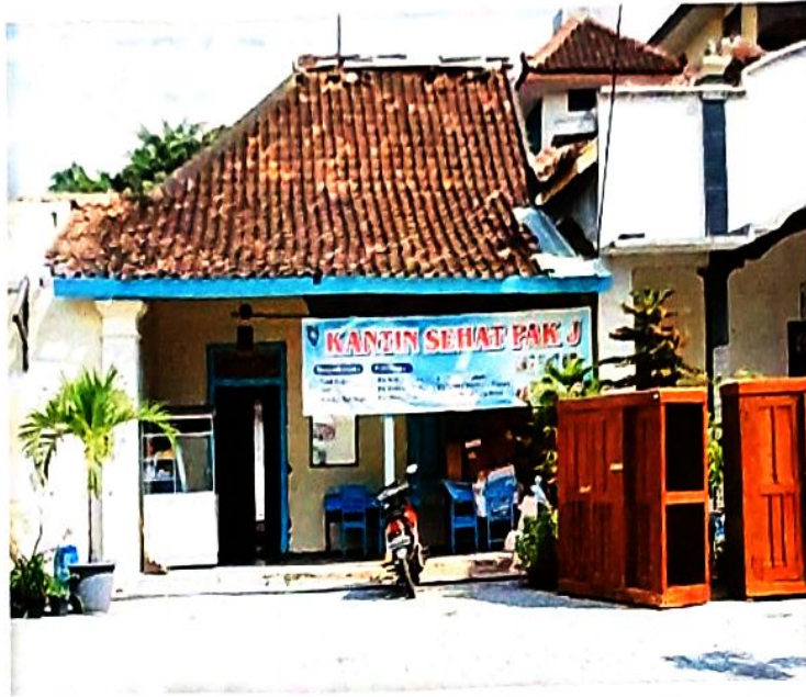
Foto 10 Tampak Gandhok Barat Dalem Jayanegaran