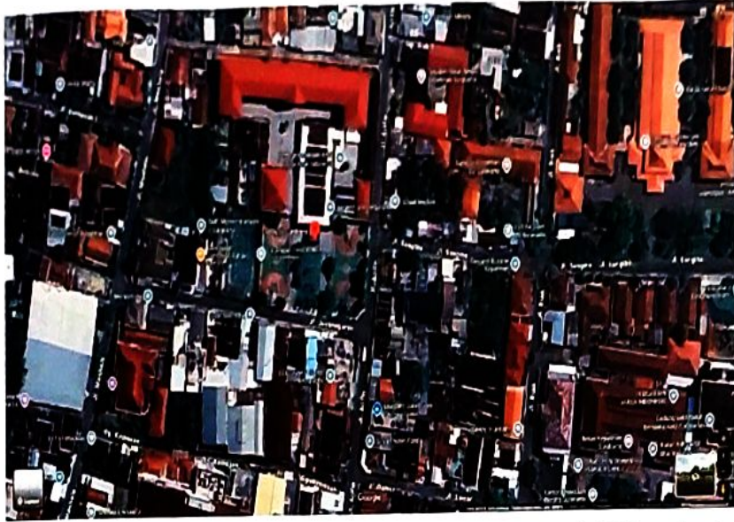
Gambar 1 Peta Lokasi Dalem Jayanegaran di SMP Negeri 26 Surakarta