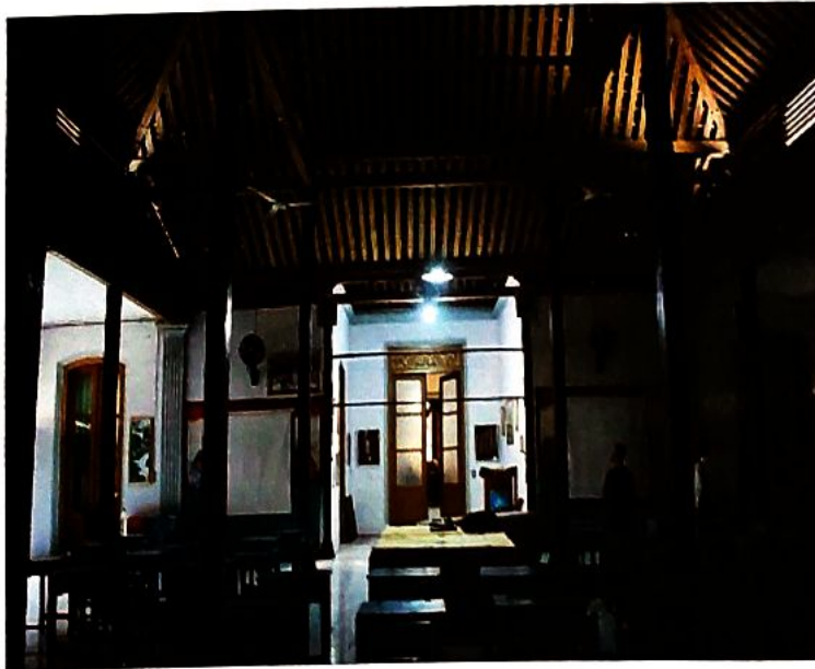
Foto 7 Tampak Pringgitan Dalem Jayanegaran