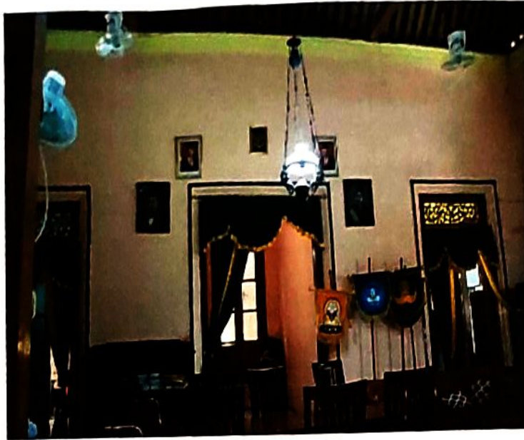
Foto 8 Tampak Dalem Ageng Dalem Jayanegaran