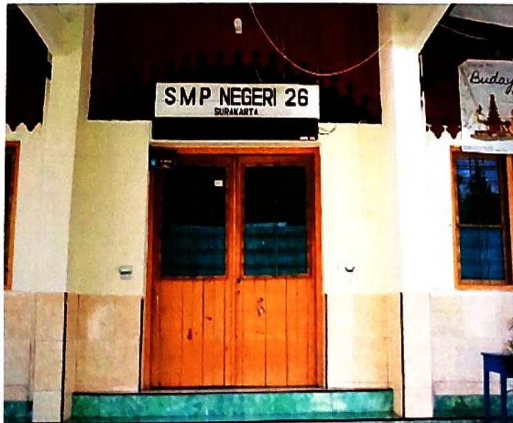
Foto 5 Pintu Utama Menuju Pendhapa Daalem Jayanegaran