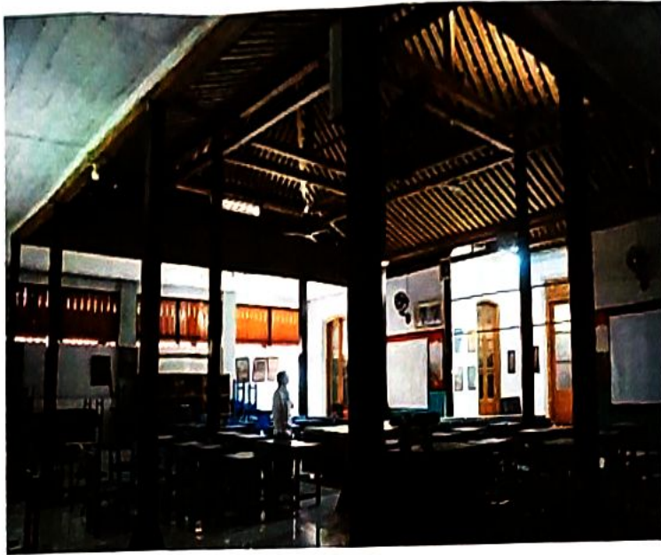
Foto 6 Tampak Dalam Pendhapa Dalem Jayanegaran