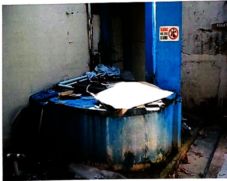
Foto 11 Tampak Sumur di Belakang Gandhok Timur Dalem Jayanegaran