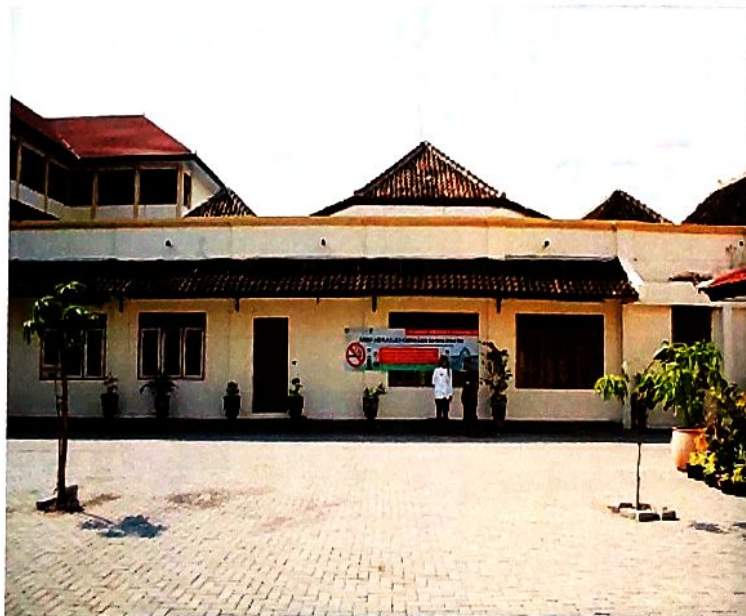
Foto 3 Tampak Samping Timur Dalem Jayanegaran