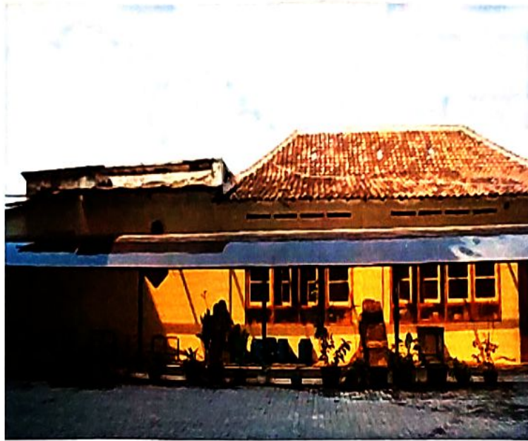
Foto 4 Tampak Belakang Dalem Jayanegaran