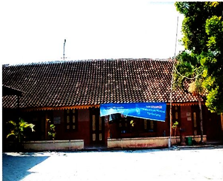
Foto 9 Tampak Gandhok Timur Dalem Jayanegaran