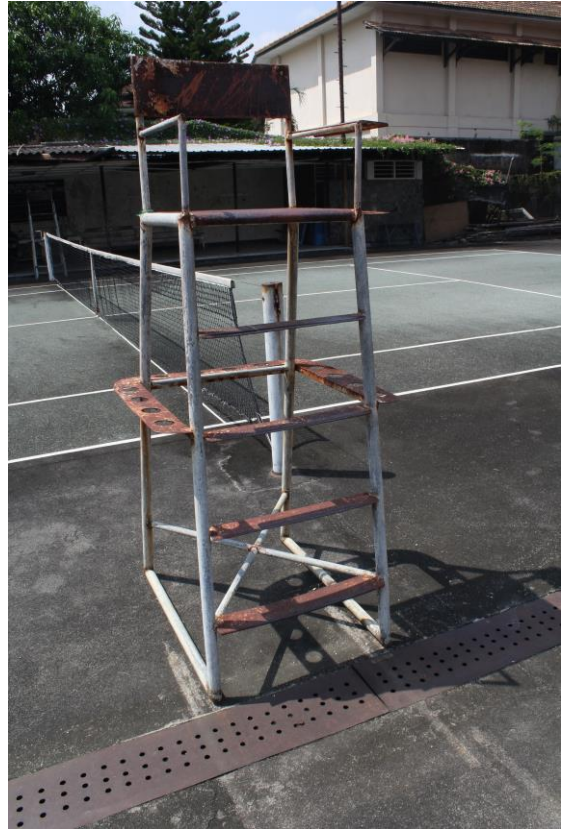
Kursi Wasit Lapangan Tenis Banjarsari