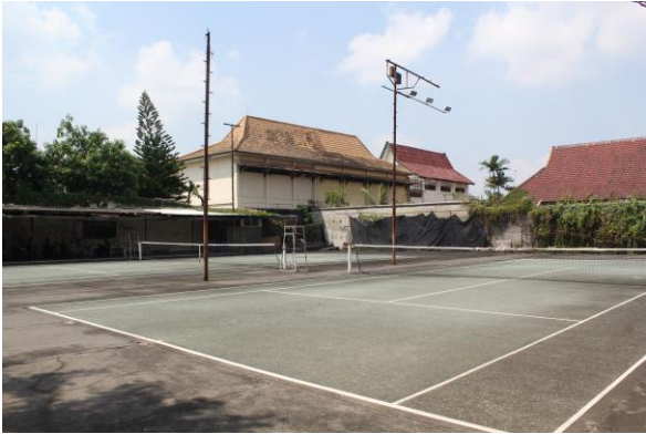
Struktur Lapangan Tenis Banjarsari