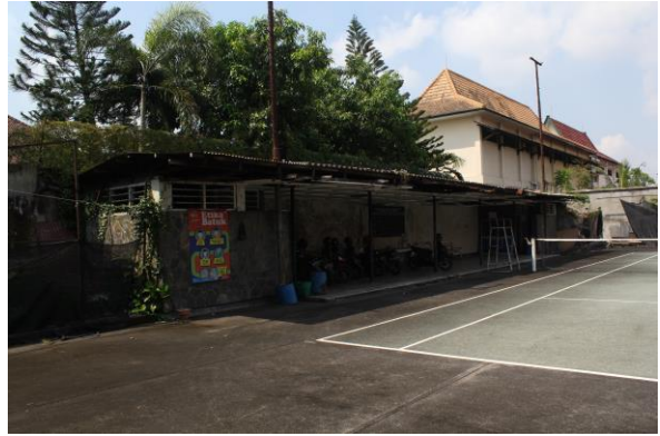
Bangunan pada Lapangan Tenis