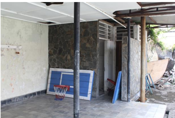
Ruang sebelah selatan di Lapangan Tenis