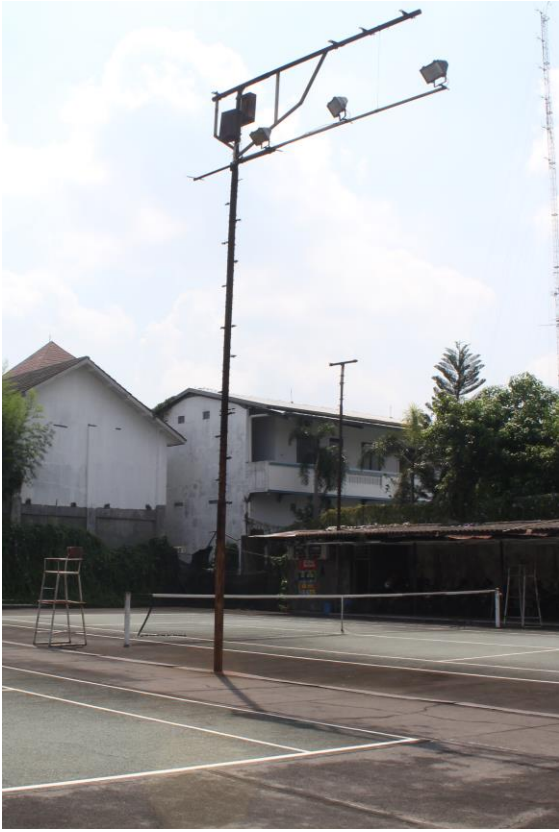
Tiang Lampu Lapangan Tenis Banjarsari