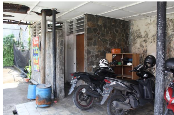
Ruang sebelah utara di Lapangan Tenis