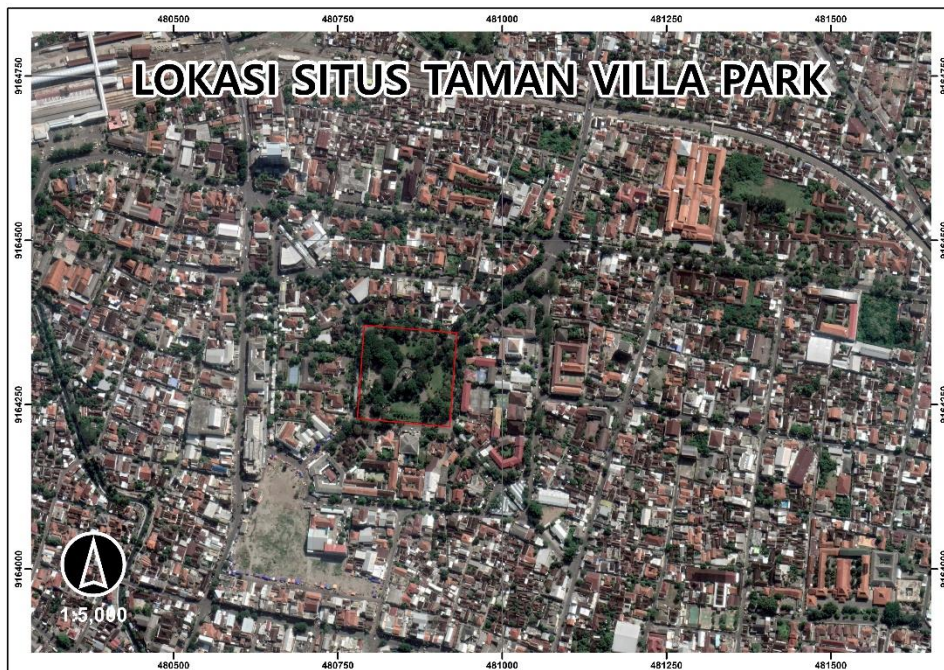
Lokasi Situs Taman Villa Park Banjarsari