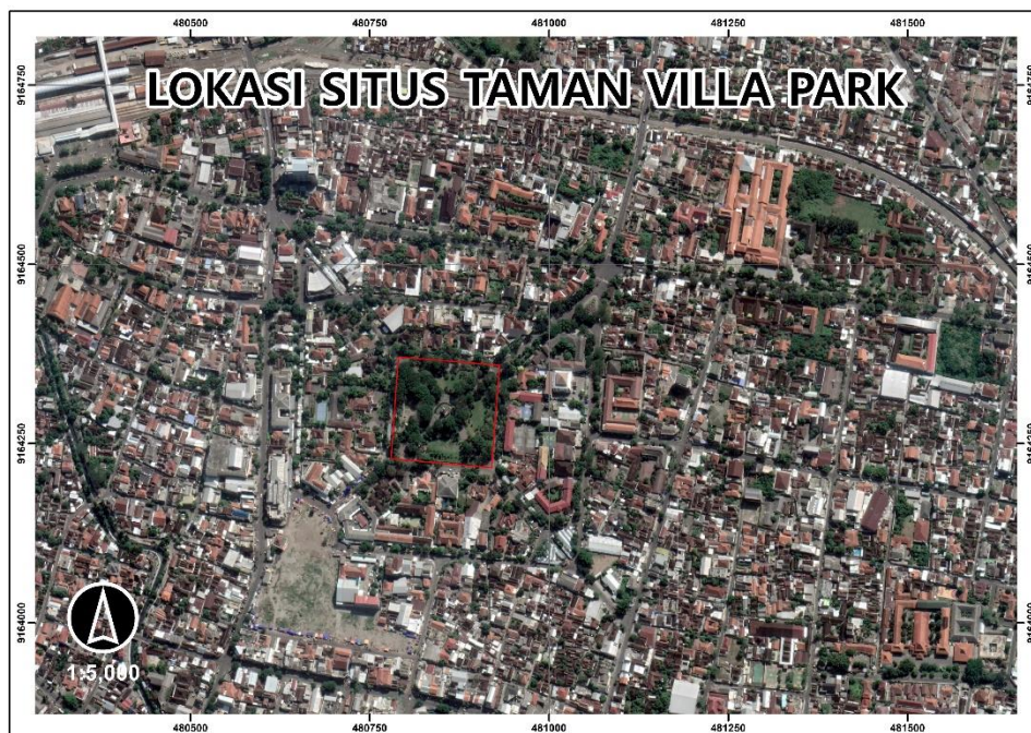
Lokasi Situs Taman Pojok Villa Park Banjarsari