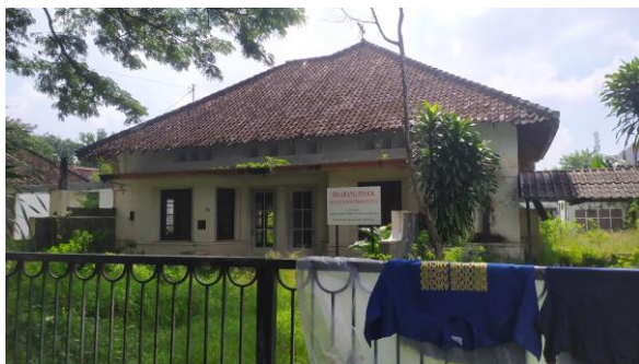
Bangunan Eks CPM Belanda dari arah Timur