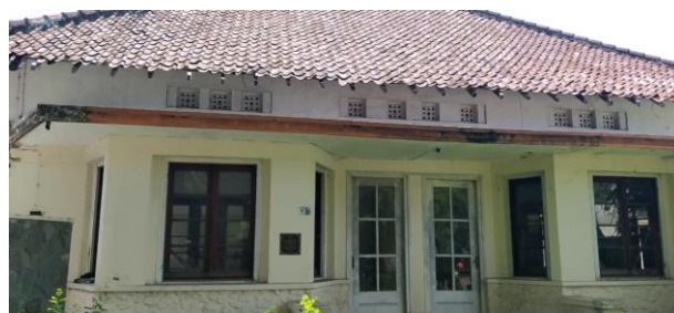
Bagian Jendela dan Lubang Angin Bangunan