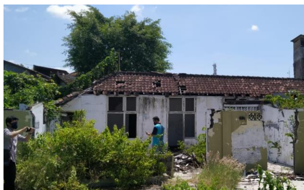
Ruang Servis