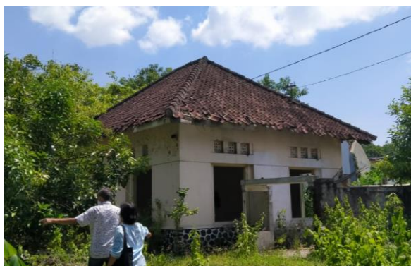
Bangunan Paviliun