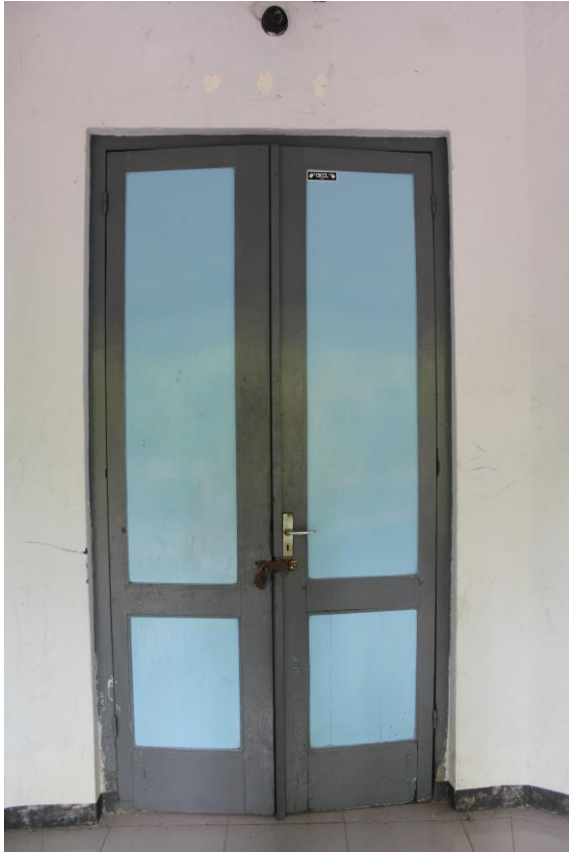
Pintu Kelas Ruang Kelas