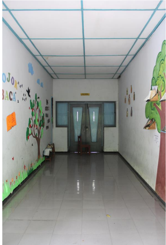
Lorong Masuk SMK Kristen 2 Surakarta