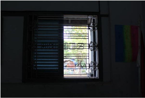
Terali Besi Lama pada Jendela Ruang Kelas