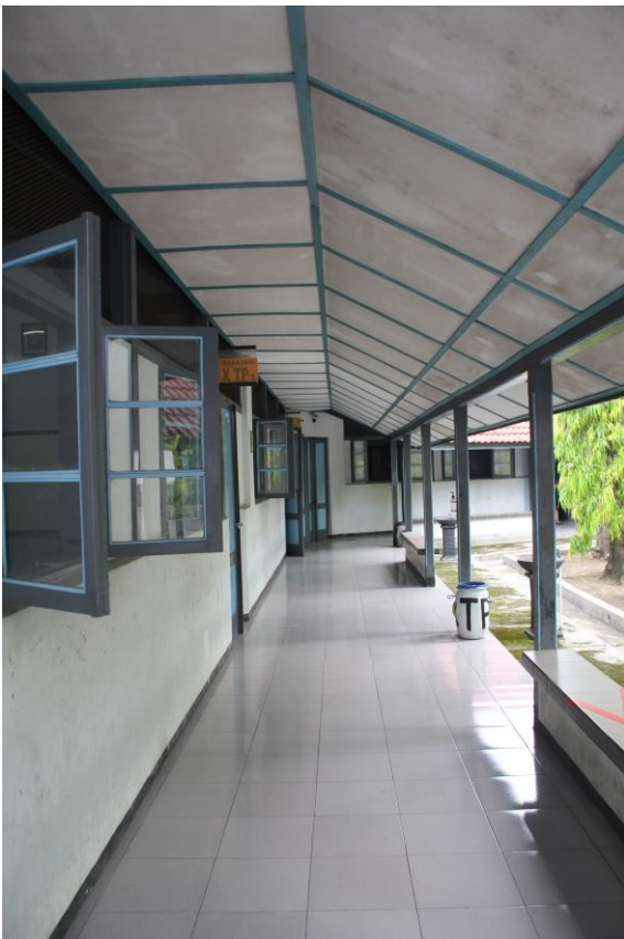
Teras Ruang Kelas SMK Kristen 2 Surakarta