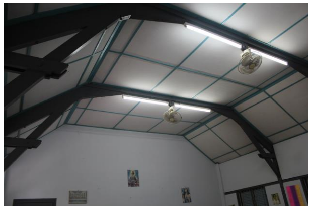
Desain Plafon Ruang Kelas Tipe B