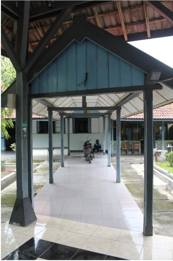
Jalan Lorong ( doorloop ) Aula dengan Ruang Kelas SMK Kristen 2 Surakarta