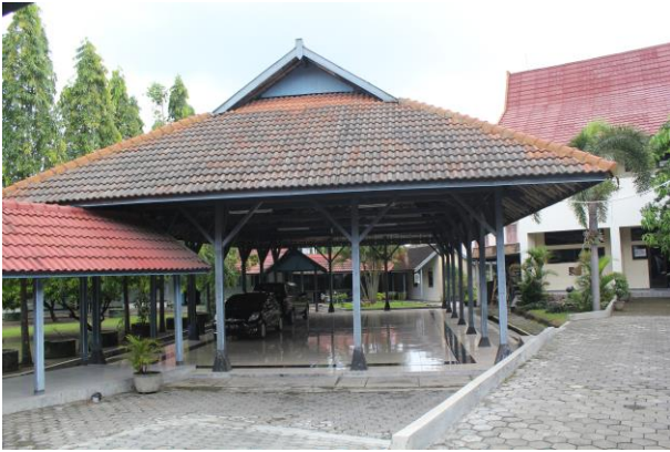
Aula SMK Kristen 2 Surakarta