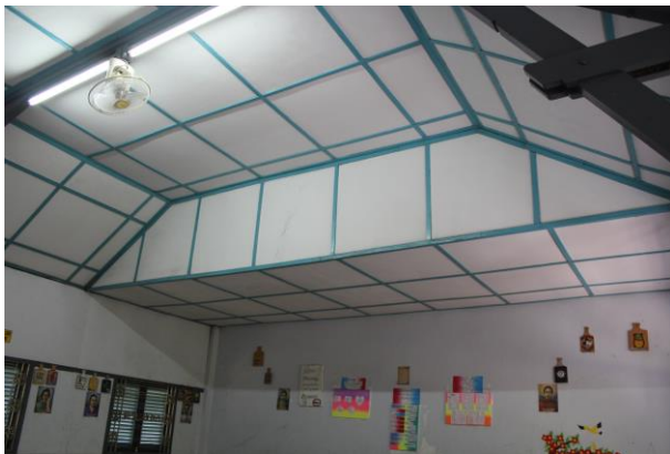
Desain Plafon Ruang Kelas Tipe A