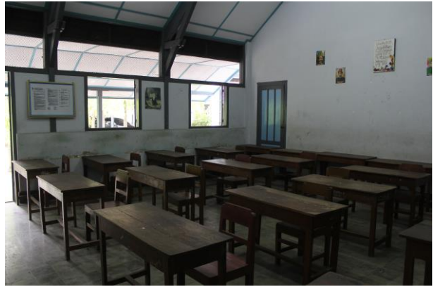
Ruang Kelas SMK Kristen 2 Surakarta Sumber: Dinas Kebudayaan Kota Surakarta, 2021