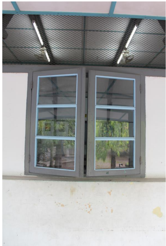
Jendela dan Lubang Angin Ruang Kelas