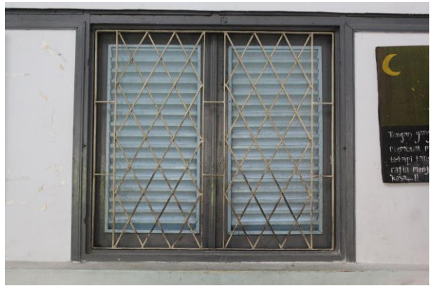
Terali Besi Baru pada Jendela Ruang Kelas