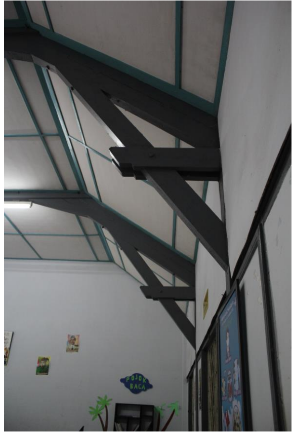
Konsol Kayu pada Plafon Ruang Kelas